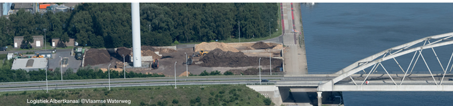
Logistiek Albertkanaal